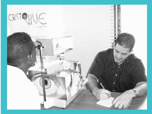
Miembros de la Fundación Cristo Vive y de la Optica Issa que trabajaron en el operativo oftalmológico

✓ Operativo...!!! La Fundación Cristo Vive sigue dando continuidad a sus proyectos de ayuda a las personas de escasos recursos económicos. El pasado sábado 26 de agosto realizó un operativo oftalmológico atendiendo a personas del sector Los Platanitos y zonas aledañas. Agradecemos a la Optica Issa por su gran colaboración para que este operativo fuera un éxito.