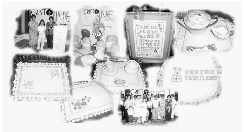
Curso de Bordado