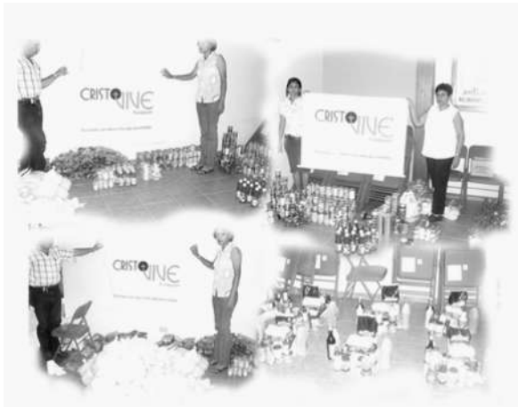
Preparación de las Canastas Navideñas